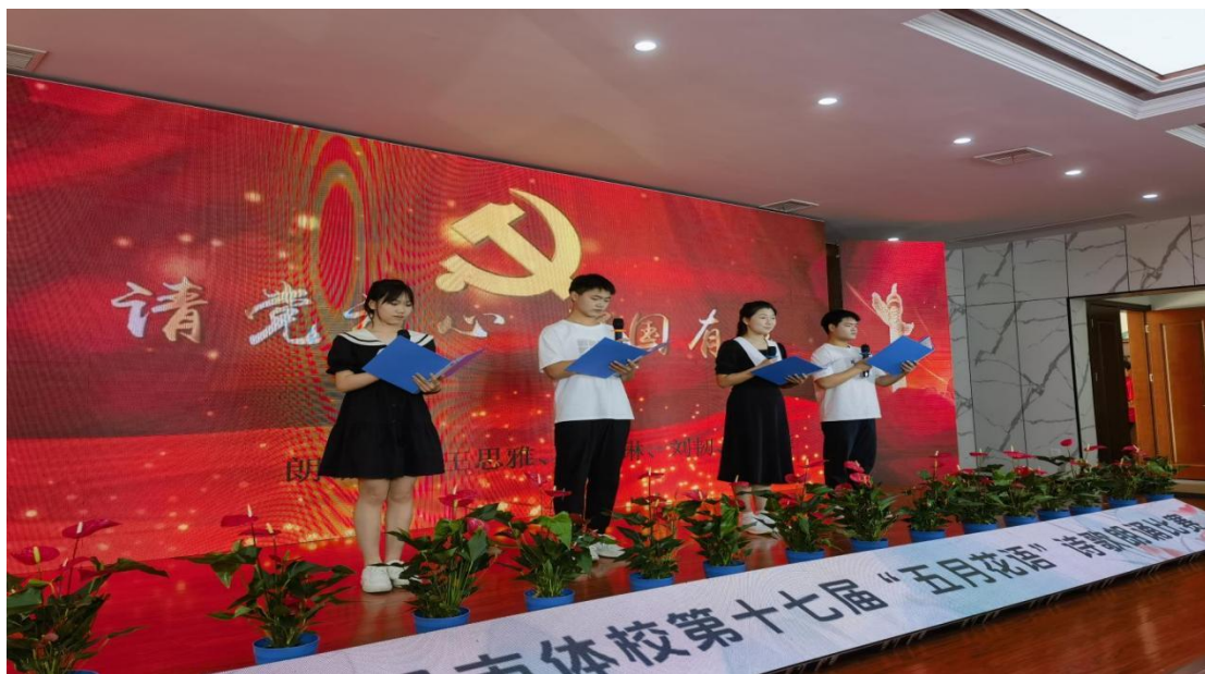
图 2-4 “五月花语”活动，让学生展示自己的艺术才华和创作成果

学校在开设美术、音乐等常规艺术课程的基础上，还独具匠心地开设了美术、音乐、舞蹈等校本课程，为学生搭建了一个全面发展的广阔平台。每学期，学校借助“五月花语”“元旦文艺汇演”等平台，让学生尽情展现艺术才华与创作成果。同时，学校还定期组织艺术讲座、工作坊等活动，邀请专业艺术家进校指导，拓宽学生的艺术视野，提升他们的审美能力和创造力。此外，学校还鼓励学生参与各类艺术比赛和展览，培养他们的竞争意识和团队协作能力，为他们的未来发展打下坚实的基础。