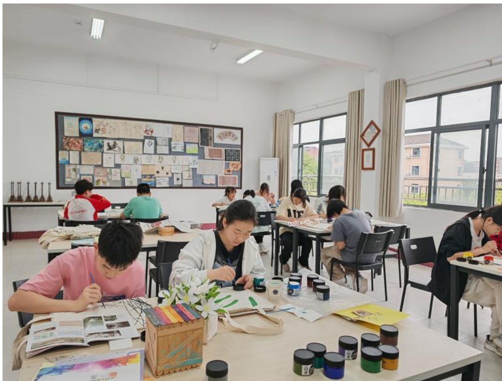
图 2-9 学生美术课

校学生会宣传部干事。美育活动成为校园文化品牌之一，各市级体校到宜昌体校进行调研时，获得一致好评，推动学校从“单一体育训练”向“五育融合”发展，让“以美促体、以体载美”理念落地。