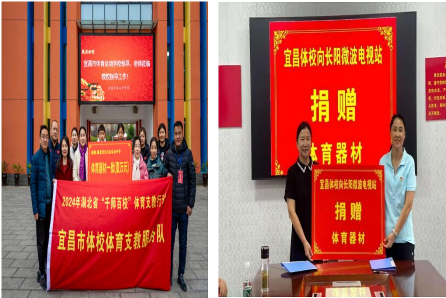
图 3-4 器材物资配套捐赠

二是器材物资配套捐赠，夯实长效育人基础。坚持“教学+保障”同步推进，针对支教学校器材匮乏的实际需求，精准捐赠足球、篮球、体操垫、体质监测设备等体育物资。捐赠物资不仅用于日常教学，还助力各学校组建运动队、开展课后体育服务，推动支教成果从“短期活动”向“长期培育”转变，为我市体育人才梯队建设奠定坚实基础。