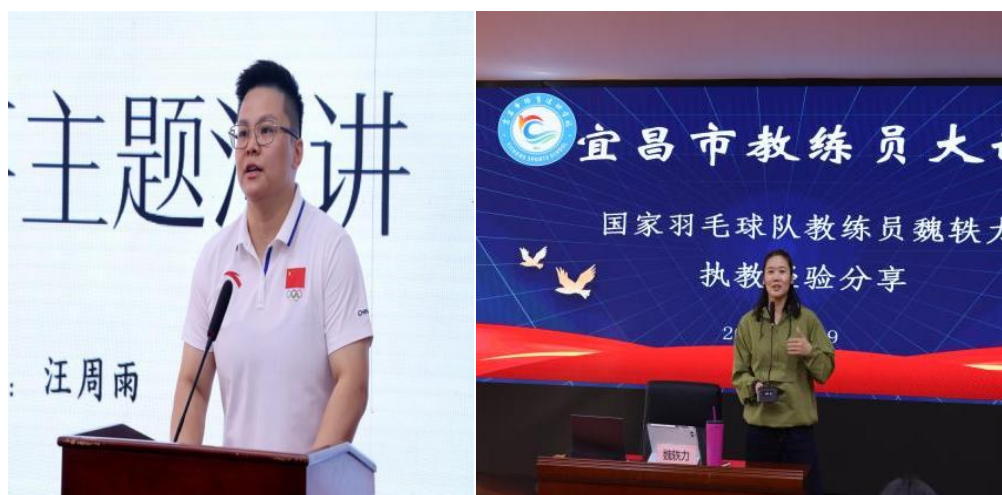
图 3-5 冠军榜样进校园

特色活动，邀请全国体育冠军走进支教学校，以“冠军成长分享会+技能示范课”的形式，分享拼搏故事、展示专业动作。以“看得见、触得到”的榜样力量，激发学生运动热情，传递“永不言弃”的体育精神，使支教行动更具精神感染力。