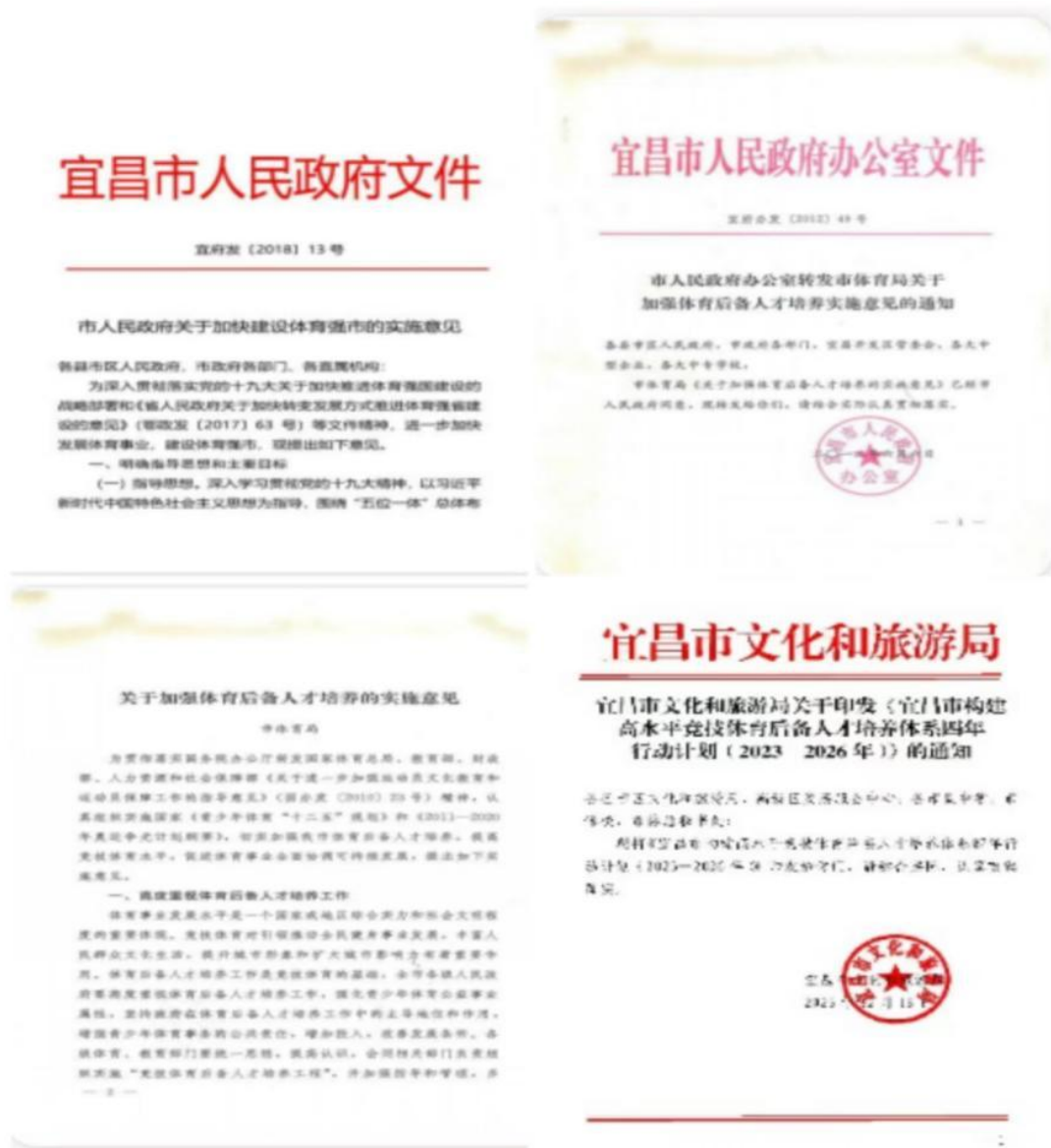
图 5-3 政策性文件支持