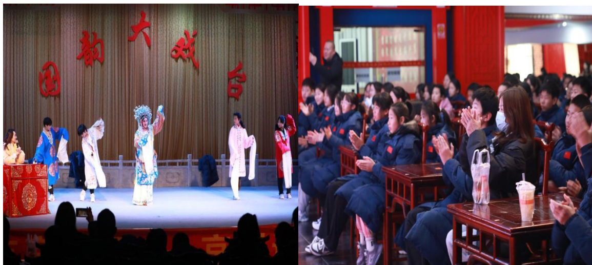
图 4-1 全校学生到宜昌市京剧团近距离体验京剧文化

为弘扬中华优秀传统文化，增强文化自信，促进戏曲传承与发展，学校积极响应国家对人才培养规格与质量的新要求。学校组织全校学生到宜昌市京剧团，让学生了解京剧的专业知识，近距离欣赏京剧，提高学生对京剧艺术的兴趣与热爱，发展学生综合艺术表演素养和创新能力。通过“走近戏曲”活动，让戏曲文化来到体校学生身边，增强了学生戏曲通识教育，弘扬了传统文化艺术，提高学生戏曲素养，推动地方戏曲保护、传承和发展，让学生们充分体验了戏曲的魅力。