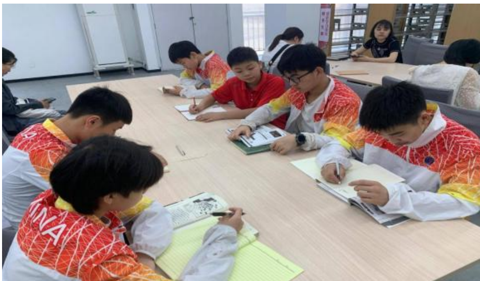
图 2-5 “师生共读 阅见未来” 首届校园阅读节活动开展