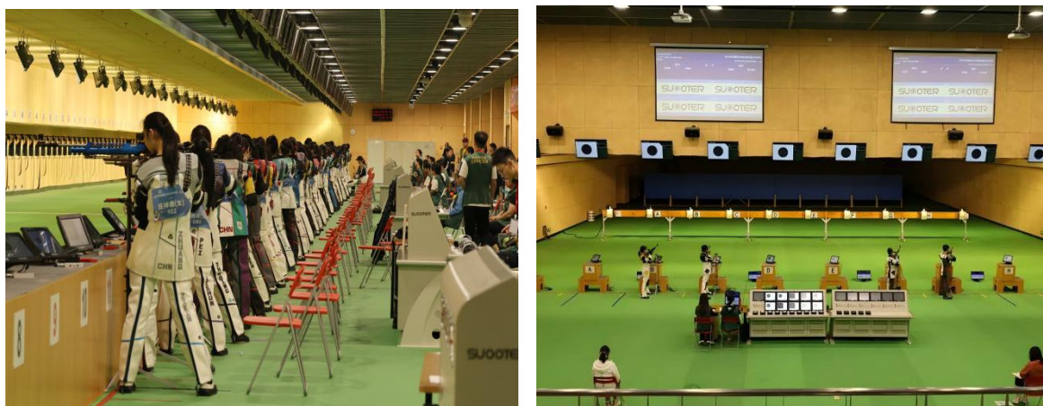
图 3-1 2025 年全国青少年射击锦标赛