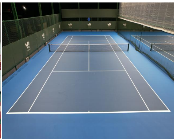
图 1-6 网球场

本单位资产总量为：5126.96 万元。资产构成情况：流动资产 481.37 万元，占比为：9.39%；固定资产 4637.92 万元，占比为 90.46%；无形资产 7.67 万元，占比为：0.15%。单位现有全民健身中心，射击馆，学生公寓食堂及教学楼等房屋，车辆一台。