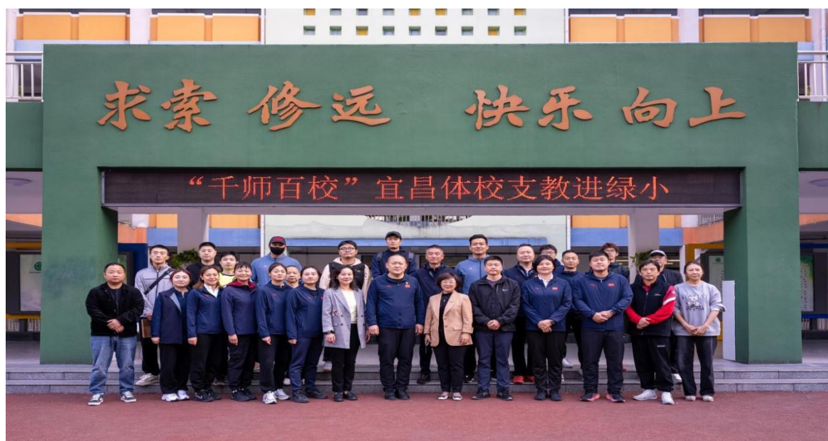
图 2-7 体育支教进校园

质量的教学反思或论文，学期末做好结对教研工作总结。六名青年教师共计参与教研活动近 20 次，参加市级公开课听课 80 余节。青年教师纷纷表示，经过一年的结对活动，她们的师德修养和业务水平得到了相应提高。