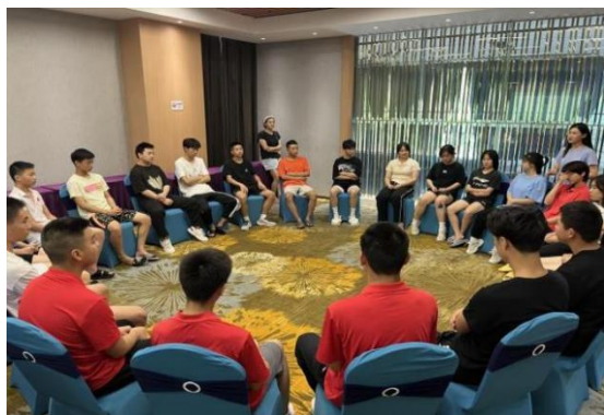
图 2-2 心理健康应对辅导

年，教务科组织全校学生进行线上心理测评1次，开展心理团建活动2次，平时对教师进行心理健康应对辅导，通过一系列有效措施对特殊心理学生进行心理辅导，为学生健康成长保驾护航。