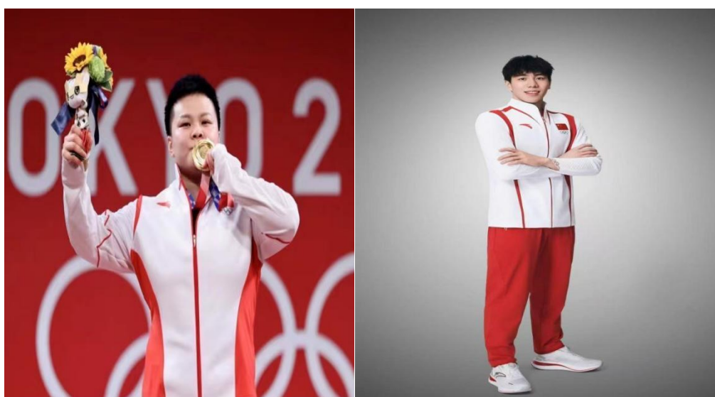
图 1-7 奥运冠军汪周雨、孙佳俊

自建校以来，我们学校输送了 222 名优秀运动员至国家队和省运动队，其中包括魏轶力、赵芸蕾等知名运动员。这些运动员在国际大赛上共获得 79 枚金牌，展现了我们学校在竞技体育领域的卓越贡献。在近 5 届奥运会上，我们的运动员共赢得 4 枚金牌和 2 枚铜牌，其中包括 2020 年东京奥运会汪周雨的金牌和 2024 年巴黎奥运会孙佳俊的金牌。此外，在 2021 年第十四届全国运动会上，我们的运动员共获得 3 枚金牌、4 枚银牌和 2 枚铜牌。在 2021 年尤伯杯中，李汶妹带领队伍夺冠，而在 2022 年亚洲举重锦标赛上，向术林荣获 3 枚银牌。2022 年新加坡公开赛中，杜玥和李汶妹组合在女双比赛中表现出色，以 2 比 0 战胜印度组合丹杜/苏尼尔，成功晋级八强。她们在该赛事中的最终成绩为第三名。