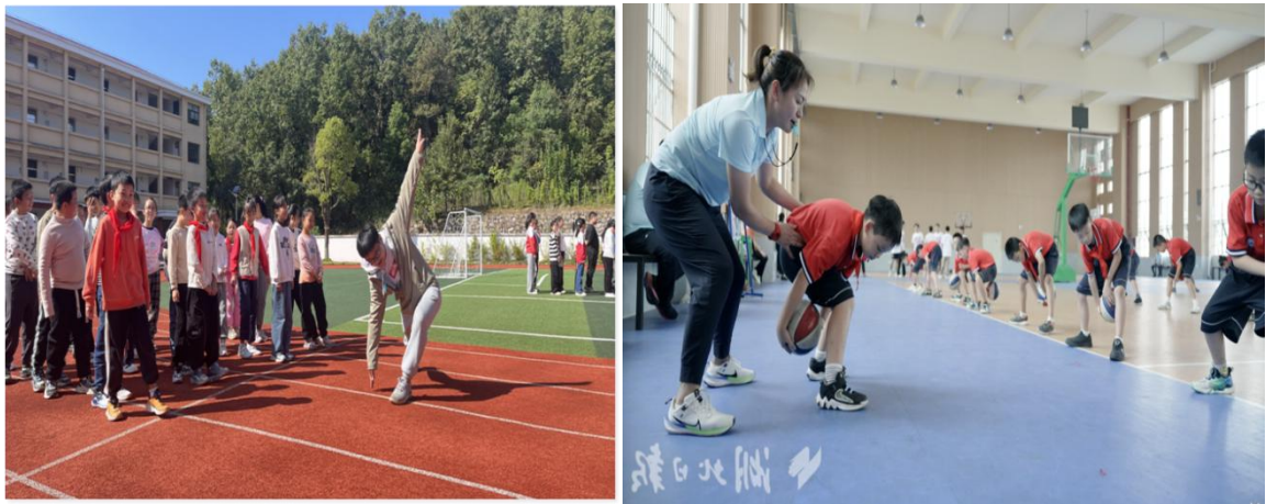
图 3-3 开展体育支教

二是器材物资配套捐赠，夯实长效育人基础。坚持“教学+保障”同步推进，针对支教学校器材匮乏的实际需求，精准捐赠足球、篮球、体操垫、体质监测设备等体育物资。捐赠物资不仅用于日常教学，还助力各学校组建运动队、开展课后体育服务，推动支教成果从“短期活动”向“长期培育”转变，为我市体育人才梯队建设奠定坚实基础。