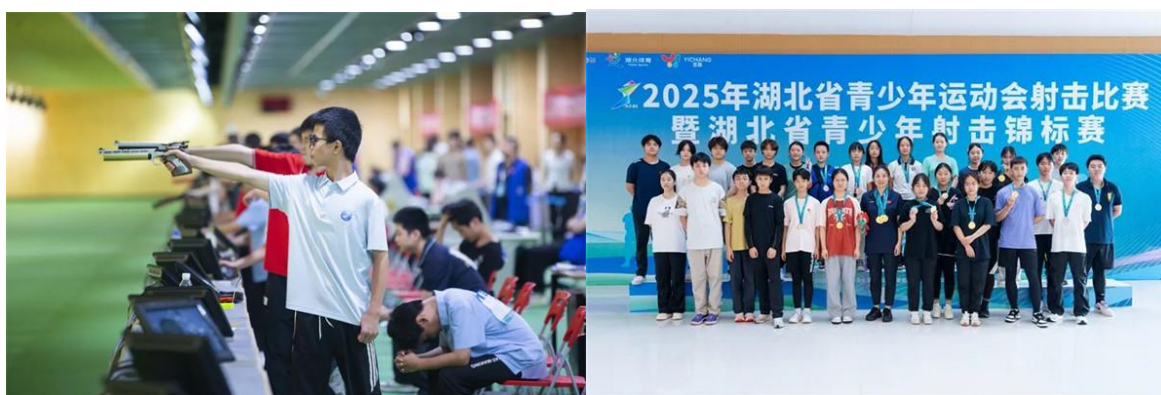
图 3-2 2025 年湖北省青少年射击锦标赛