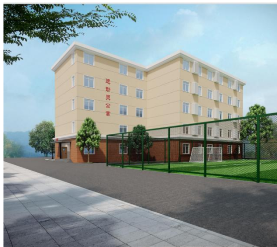
图 1-2 宿舍楼

在 2024 年 9 月 1 日至 2025 年 8 月 31 日期间，学校 2024 级中一新生招生数为 54 人，2023 级学生数为 52 人，2022 级学生数为 57 人。