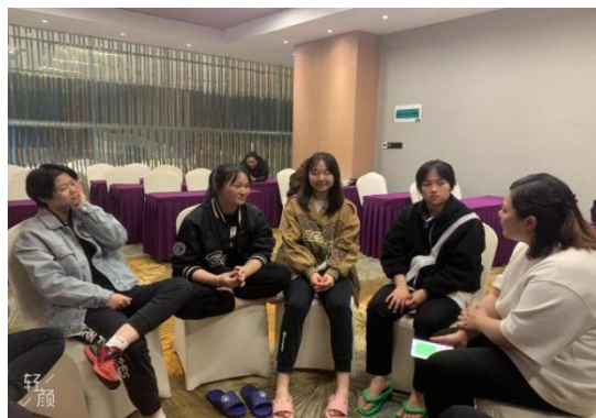
图 2-3 心理老师进行心理辅导