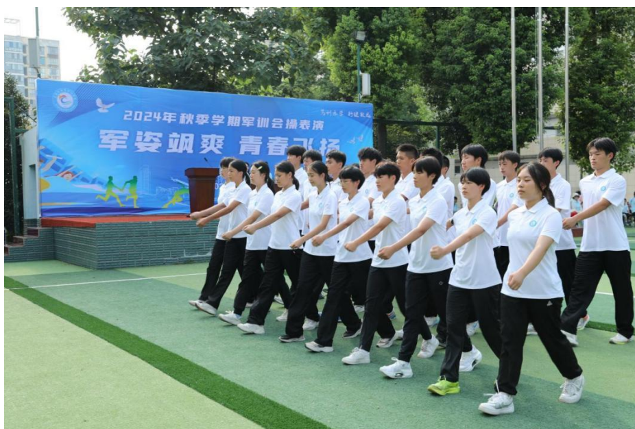
图 2-1 军训会操

本年度，学校精心策划了丰富多彩的文明风采活动，诸如“文明礼仪月”“军姿飒爽，青春飞扬”“红色足迹映初心，清明祭扫缅英魂”“探索三峡大坝，铭记科学之旅”等，这些活动不仅传承了中华民族的传统美德，更提升了学生的文明素养与诚信意识。通过这些活动，学生们学会了如何尊重他人、关爱社会，成长为有道德、有纪律、有文化的时代新人。