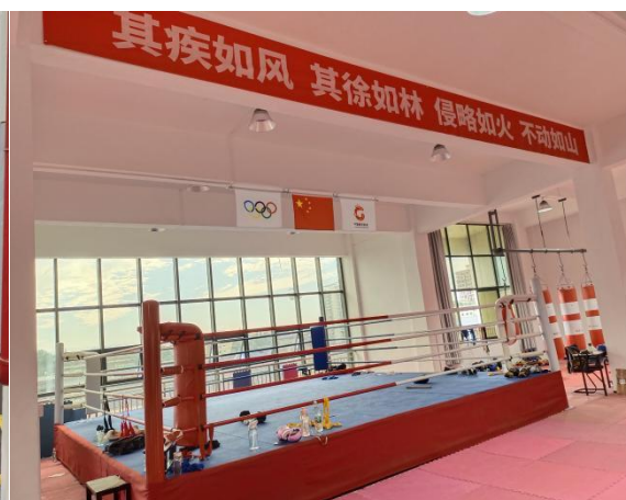
图 1-4 拳击馆