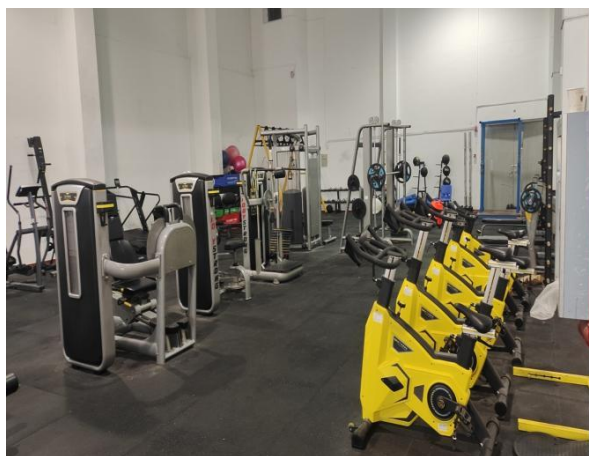
图 1-3 体能房

校园内教学楼、办公楼、综合训练馆（羽毛球场 12 片、篮球场 2 片、武术馆、柔道馆、拳击馆、跆拳道馆）、标准田径场、奥体射击馆、网球场（6 片）、足球场、室内恒温游泳馆、举重馆、学生公寓、食堂等楼舍场馆错落有致。学校总建筑面积为 5 万平方米，生均校园占地面积 310.5 平方米。校舍建筑面积约 3.7 万平方米，生均校舍建筑面积为 230 平方米。2023 年为了改善训练环境，对网球场、室内篮球场进行维修改造。教学及辅助用房 10391 平方米，生均教学及辅助用房 80.55 平方米。