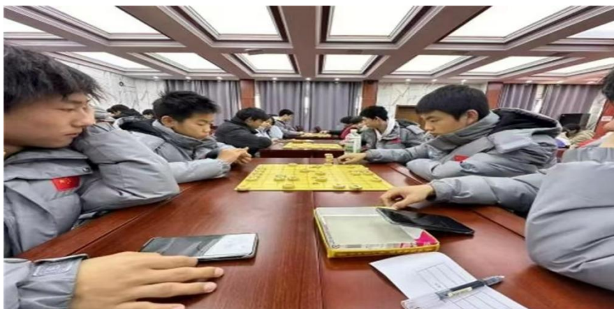
图 2-6 校园象棋和五子棋大赛活动

为锻炼学生的逻辑思维能力、专注力与耐心，提升学生的理科综合素养，同时为棋艺爱好者提供展示舞台，推动象棋与五子棋文化在校园的传播与发展，“棋逢对手，乐在‘棋’中”校园棋艺大赛于 11 月如期举行。