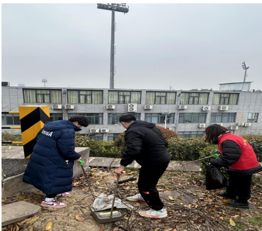
图 2-3 学生志愿者在校园进行志愿服务

我们积极参与文明创建活动，如每月评选一次“优秀文明班集体”“优秀文明宿舍”等，提高了学生的文明素养和集体荣誉感。定期组织朝气蓬勃的学生志愿者在校园、社区开展志愿服务活动，他们通过认真打扫卫生、仔细拾烟头、彻底清除小广告、积极进行科普宣传等实际行动，充分展现了体校学生的良好精神风貌，让文化创建焕发出璀璨光彩。