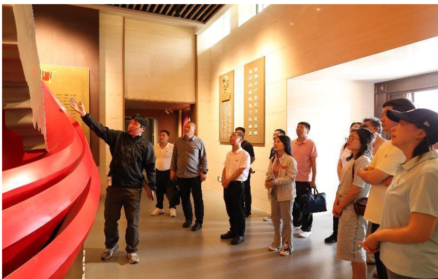
图 5-2 支部开展红色教育