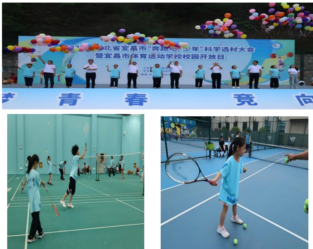
图 2-8 2025 年校园开放日照片