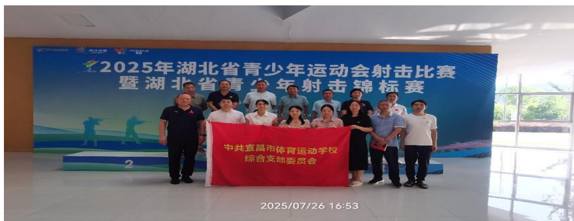
图 5-1 学校综合支部积极参与活动

聚焦教学、训练、赛事、管理四大核心领域，设立 6 个党员示范岗，按“点上突破、面上覆盖”推进工作。党员骨干扎根科学选材、科学训练一线，以“训练出人才、比赛出成绩”为目标；成立党员志愿者服务队，带动全体党员、职工参与赛事服务与“校园开放日”保障，优化赛事赛场环境，助力运动员“赛出水平和成绩”。