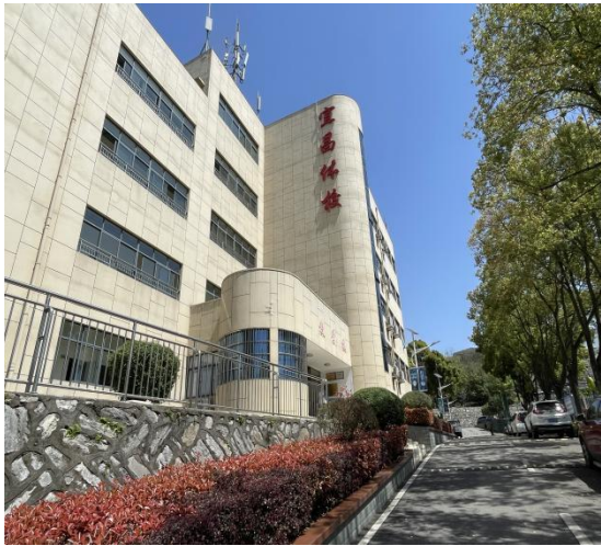
图 1-1 教学楼

“全国体育事业突出贡献奖”，这是国家体育总局对在青少年体育工作领域做出显著贡献的集体和个人的表彰。